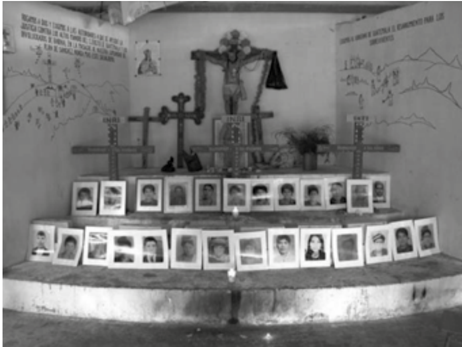
Capilla construida en Plan Sánchez, donde ocurrió una masacre, 2002.

los niños experimentaron la violencia de una manera personal y profundamente arraigada. Eran demasiado jóvenes para comprender los aspectos sociopolíticos de la violencia en la que nacieron o para poder vincular a la violencia con temas más amplios, los niños experimentaron la violencia como algo personal.