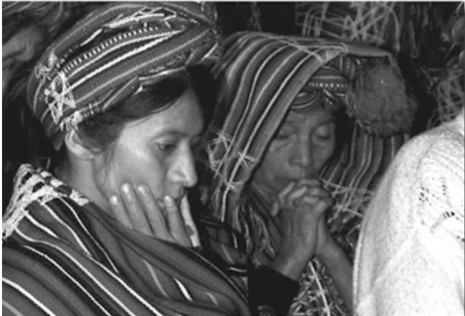
Sobrevivientes de la masacre de Acul de 1982, durante la exhumación en 1997.

La combinación de pobreza, la violencia post-genocidio y una generación quebrantada, sobreviviente del genocidio, han confluído en el aumento de la violencia intrafamiliar, de pareja íntima y comunitaria. El recurso del ejército a la violencia se repite de diferentes formas en toda la sociedad guatemalteca. Los que tienen menos poder, las mujeres y niñas indígenas, tienen menos recursos para resolver conflictos ocasionados por la violencia. Las mujeres y las niñas son vistas como propiedad y, con mayor frecuencia, son las víctimas de esta violencia.