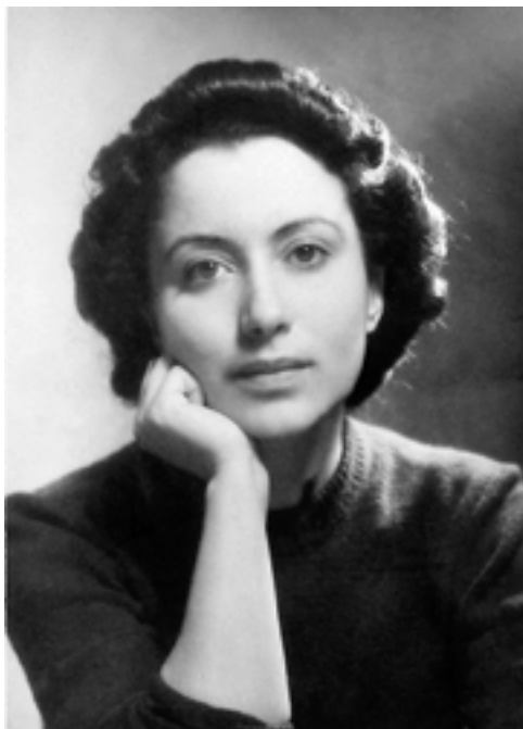
Alaíde Foppa.

Alaíde Foppa era doctora en Letras Italianas. Escribió varios artículos en la Revista Fem tales como: “Anatomía no es destino” (1976); “Mujer” (1977); “¿Salario para el trabajo doméstico?” (1977), “¿Para qué sirve la familia?” (1978); “Lo que escriben las mujeres” (1979); “El Congreso Feminista de Yucatán, 1916” (1979); “¿Qué cuestionan las mujeres de Cuestión?” (1980); “El feminismo y la izquierda” (1981), entre muchos otros. En algunos de sus artículos se muestran sus influencias del feminismo