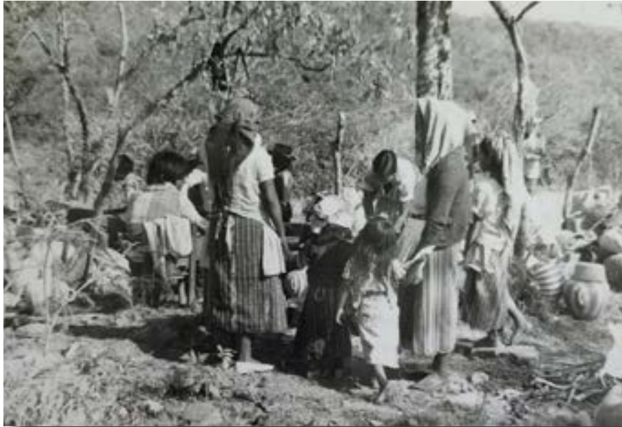
Imagen de archivo. AHDSC-FRG carpeta 1317, expediente 1.

algunos proyectos que se impulsaron y ejecutaron en los campamentos en los que ellas participaban, y cuando ellas no lo hacían muchas veces los proyectos ya no funcionaban.