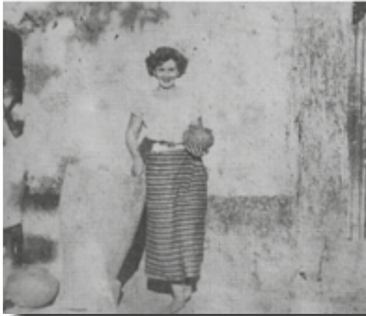
Calixta Guiteras, con traje popoluc.

randerera). Con “Los peligros del alma” quiso referirse a la creencia en el mundo tzotzil de que la sobrevivencia humana depende por completo de la preservación de las relaciones armoniosas con las deidades. Tal como Calixta muestra en el libro, en muchos mitos, la falta de respeto a esta creencia da lugar a castigos inmediatos e implacables. Por otro lado, Manuel Arias Sojom aparece en la publicación de Guiteras como