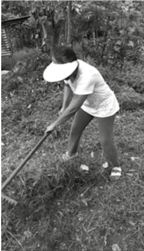
En la Pluriversidad Yutsilal Balumilal cuidando la Madre Tierra.

como solidarias en las redes altermundistas y en las “redes neoza-patistas” que bauticé de esa manera y que fuimos colectivamente creando. La resistencia en singular que se leía en el debate académico se convertía en el plural del encarnamiento, de la lucha política y de la lucha espiritual. Al final, ya en una fase más tardía, nuestra resistencia y lucha es por la vida; una lucha en la que