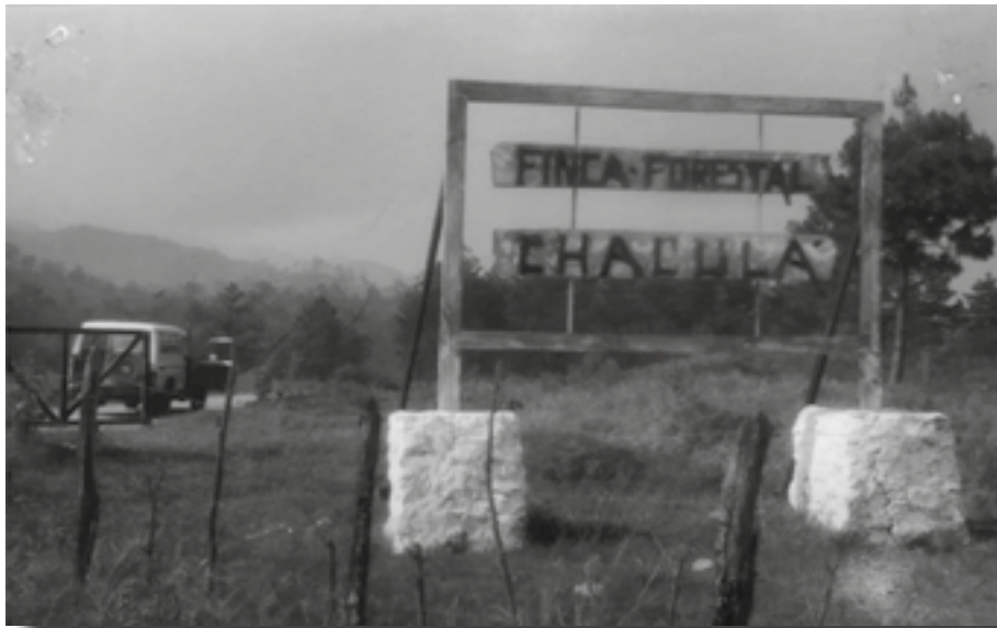
AHDSC-FRG carpeta 1321, expediente 1.

Han pasado 26 años en los que la población ex refugiada regresó a Guatemala. Cada 12 de enero –día en que llegaron a este nuevo espacio– las y los integrantes de esta comunidad realizan un ritual con alegría recordando su llegada y recordando todo el proceso por el que la población pasó. Así, no solamente el dolor y el sufrimiento atraviesa sus vivencias, sino también la valentía, la alegría de haber retornado, el amor sostenido entre mujeres, así como la esperanza de construir una vida más digna.