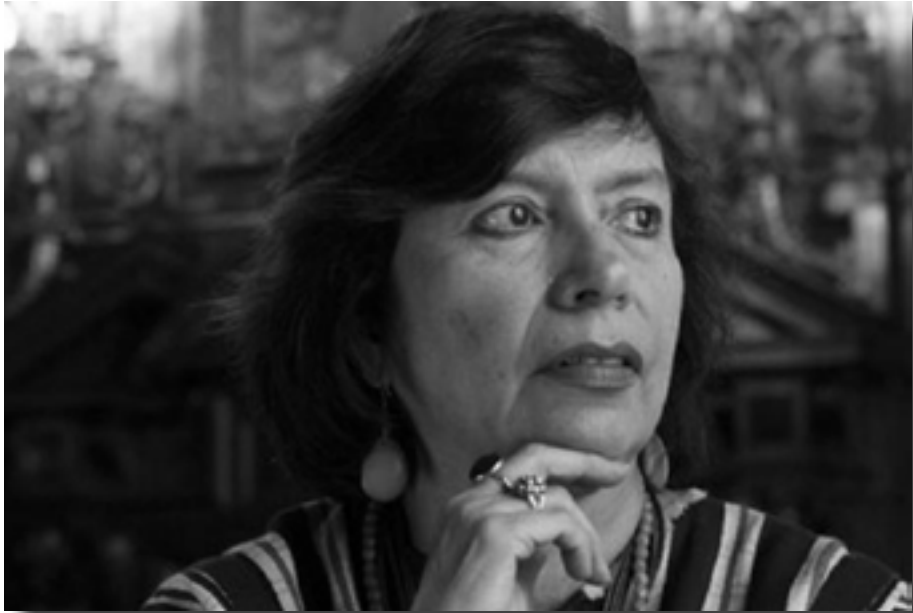
Foto. Walda Barrios-Klee. Foto tomada de archivo de FLACSO, Guatemala.

uniones y embarazos en mujeres, adolescentes y jóvenes” (2017); “Vidas Silenciadas: una tragedia de la que no se habla. Vinculación entre suicidio y embarazo en mujeres adolescentes” (2019); así como dos investigaciones sobre violencia contra personas LGBTQ+: “Violencia ejercida contra las personas LGBTI. El caso de ciudad de Guatemala” (2018); “Violencia en espacios laborales hacia lesbianas, gais y personas trans en la ciudad de Guatemala” (2019). Además, otra publicación en prensa es: “Entramado de poderes: El modus operandi de los grupos anti-derechos sexuales y reproductivos en Guatemala” (2020).