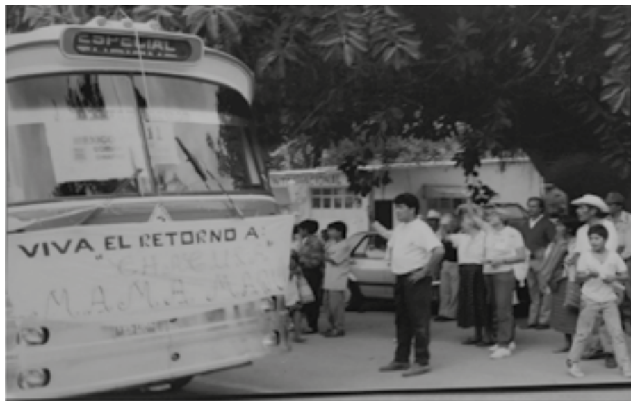
AHDSC-FRG carpeta 1315, expediente 1.

En la fotografía que mostramos a continuación se puede observar un camión con el letrero que dice “Viva el retorno a Chaculá”. Esta es una foto histórica que recuperé del Archivo Diocesano de San Cristóbal, y en la que se registró el 12 de enero de 1994, día en que algunas de las mujeres de “Mamá Maquín” retornaron y lideraron el retorno a Chaculá. Exponer en este capítulo esta fotografía forma parte de uno de los compromisos adquiridos con las mujeres de la organización, ya que me interesa crear formas para devolver la investigación a la comunidad, y compartirles el material que he encontrado es una de esas maneras de reintegrar mis hallazgos.